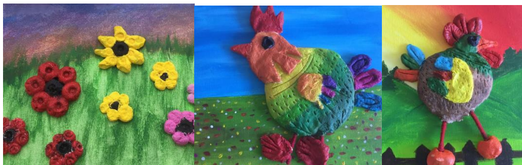
Augstā tika saņemts apliecinājums par Piedalīšanos mākslinieku izstādē Lietuvā.